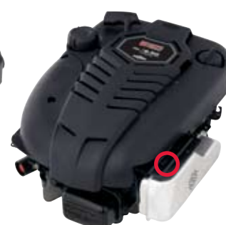
600 Series™, 800 Series™ Quantum®, Intek™