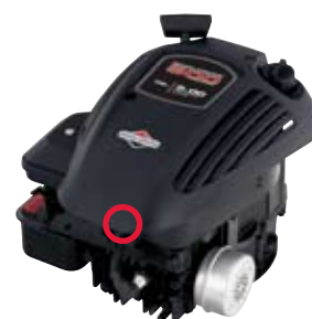
400 Series™, 500 Series™ Classic™, Sprint™, SO™, Q™